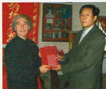
cérémonie rituelle traditionnelle de disciple interne